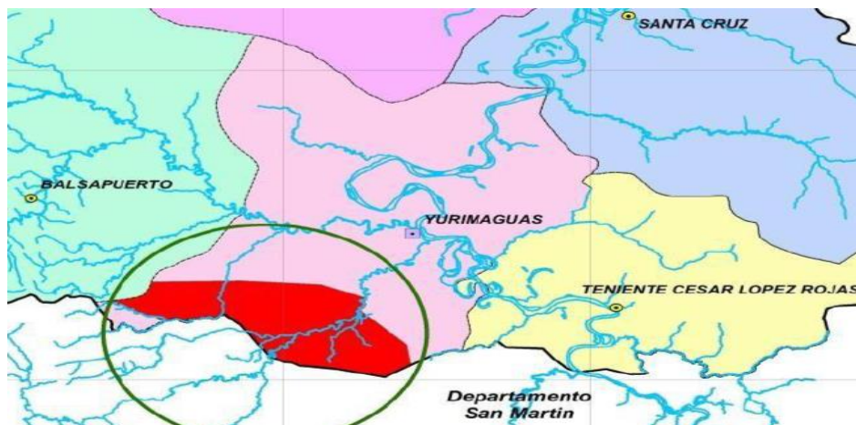
Figura N° 03 Distrito de Yurimaguas y ubicación del propuesto distrito de Shanusi