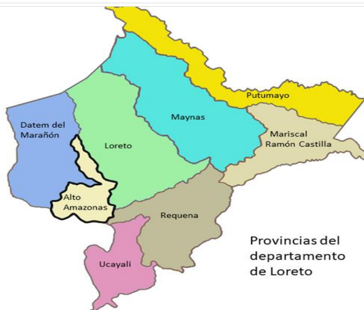
Figura N° 01 Departamento de Loreto y sus provincias

Corresponde a la creación de un distrito en el área de la selva estratégica en la jurisdicción de la provincia de Alto Amazonas, departamento de Loreto.